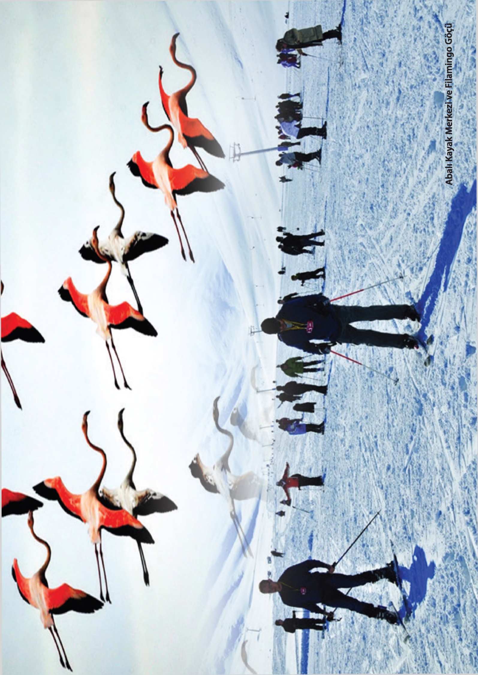
Abalı Kayak Merkezi ve Filamingo Göçü